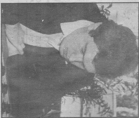
• VLADIM VIRNY

Als wit dam zou halen door 10-4 of 10-5, dat zou gevolgd zijn: 3-9 een dubbele danvangst middels 13-19 resp. 18-23 en de al genoeg getergde Rus was gelijk van alle problemen afgeweest. 42. ..., 3-9 ; 43. 14x3 , 18-22 ; 44. 3x21 , 16x27 ; 45. 10-5 , 27-31 ; 46. 42-38 , 31-36 ; 47. 5-46 , 26-31 ; 48. 29-24 , 22-28 ; 49. 46x2 , 36-41 en remise overeengekomen.