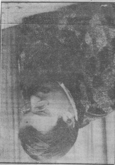
• ROB OLEHC FOTO: ANP